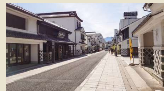
松本城の城下町や安曇野を散策して蕎麦を堪能