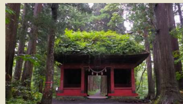
日本屈指のパワースポット戸隠、蕎麦、善光寺へ