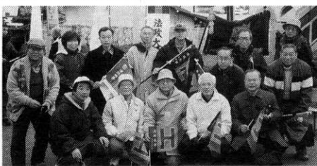
湘南支部は湘南オレンジの 会設立以来、今年で満10年を 迎える。この10周年記念行事を 開催する。

この10周年を迎えるにあ た り、更に支部組織の充実を計 るべく、会員を募集してい る。 藤沢、平塚、大和、綾瀬、 座間、海老名の各市に在住・ 在勤の同窓生の方々、入会を お待ちしております。ご希望 の方は左記事務局にご一報く ださい。