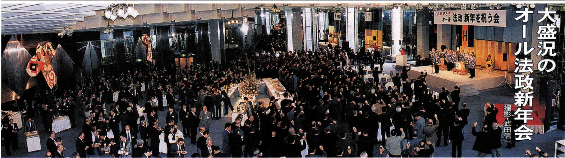
大盛況のオール法政新年会

話題は飛躍するが、政治・経済分野での意志決定に女性がどの程度参画しているか、つまり「社会における女性の活躍度」ということになるが、その国際比較の統計(国連開発計画および世界経済フォーラム)が二つある。詳細は省略するが、一つは、66カ国中で日