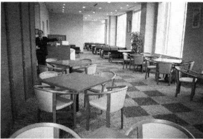
レストラン「スタッフクラブ」