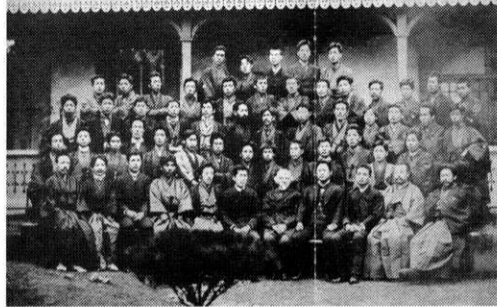
1889年3月20日(麹町区富士見町)ボアソナードを囲んで

から教頭)。二番目に「明治法律学校(二年間)」となつて、それから「和仏法律学校」で教えた。東京法政学校の「主幹」として、実質的にその中心となつたのが薩埵正邦であった。八七年に、おそらくボアソナードが中心となつて、東京法政学校と明治法律学校、そして前年できた東京法政学校を一緒にして、仏法系学校を大同団結させよう