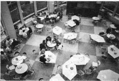
ヘリオス（学生ホール）

飯田橋から市ヶ谷にかけての桜並木、法政OBにとって、高台の外濠は今も昔も変わらない懐かしい風景である。 ただし、大きく変わったのは桜並木の上に堂々とそびえ立つポアソナードタワーの偉容である。地上26階、新しい時代を切り開く法政のシンボルといえる。 さてこのタワー、もちろん、現役学生のための施設であるが、卒業生も自由に