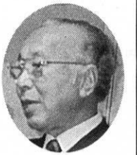
今回校友連合会会長を引き受けたのは、第一には明治20年以降、116年の歴史のある校友会が機能を果たしていない。それは、母校・法政大学の卒業生一人として誠に相済みぬ、気持ちからである。